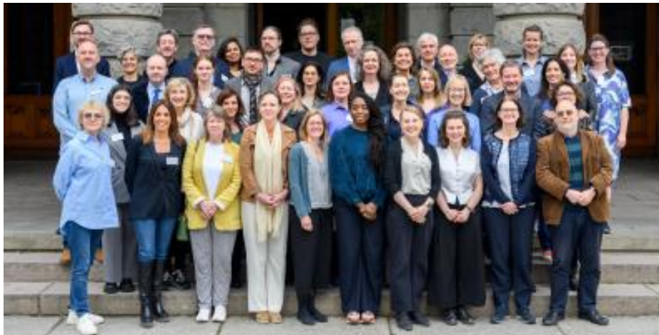
Assemblée générale de PEARLE à Oslo, mai 2023

La FEAS a également participé aux deux Assemblées générales annuelles de PEARLE, à Oslo le 12 mai (-centrée sur le développement durable et à Ljubljana, le 16 novembre 2023, centrée sur l'IA.